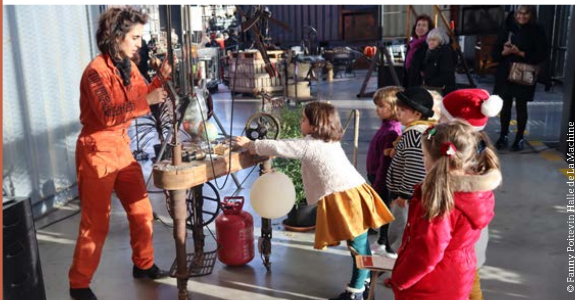
© Fanny Poitevin Halle de La Machine